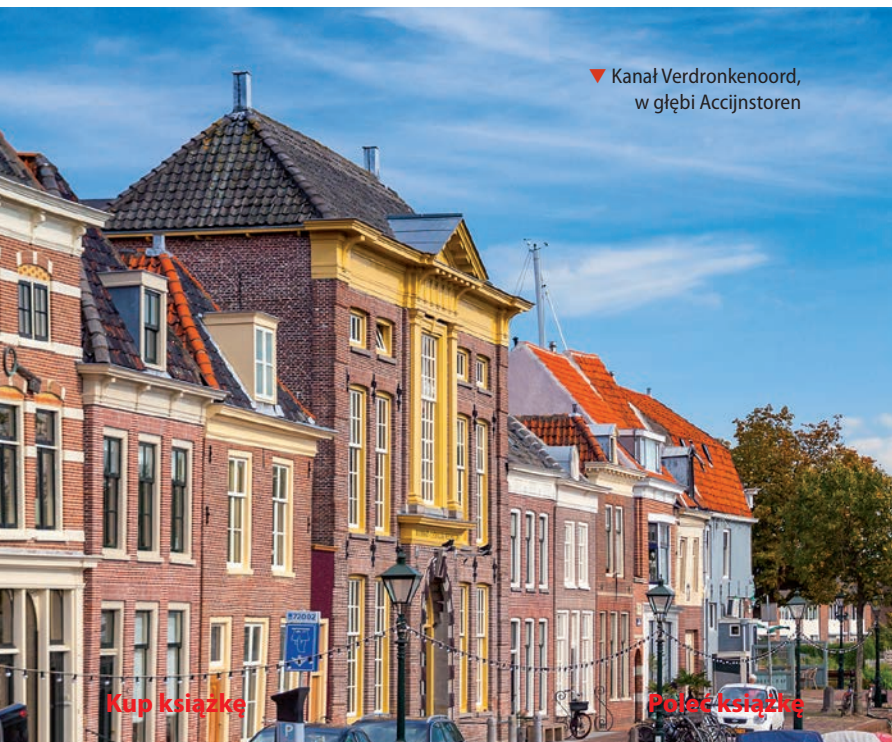
▼ Kanał Verdrongenoord, w głębi Accijnstoren