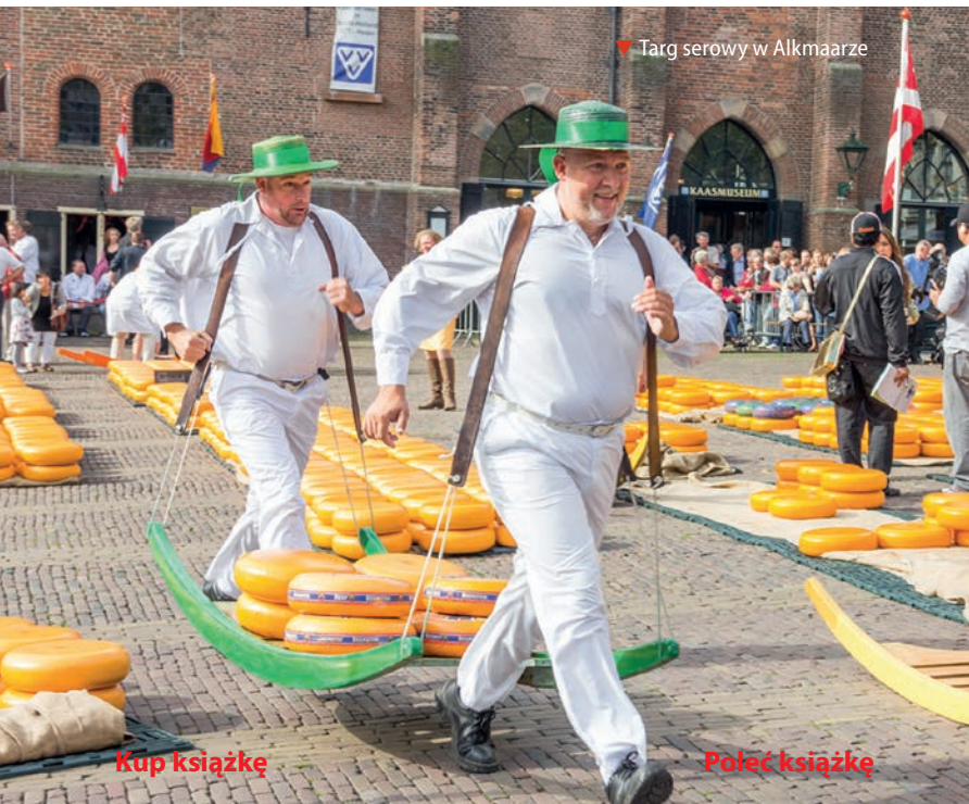
▼ Targ serowy w Alkmaarze